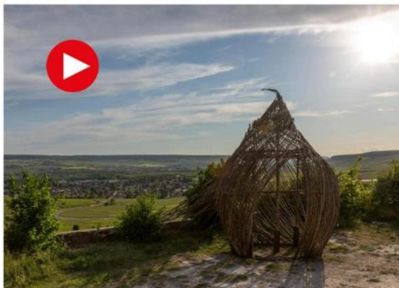
L'œuvre représente un grain de raisin géant et son nectar. Benoist Laroche